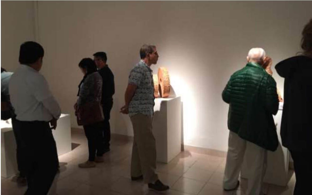
Exposición: "Construcción-deconstrucción" y "Onírico" esculturas del maestro Jovian.

Fundación Cultural Macay A.C. Actividades realizadas en Marzo de 2020.